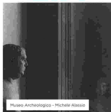
Museo Archeologico - Michèle Alassio