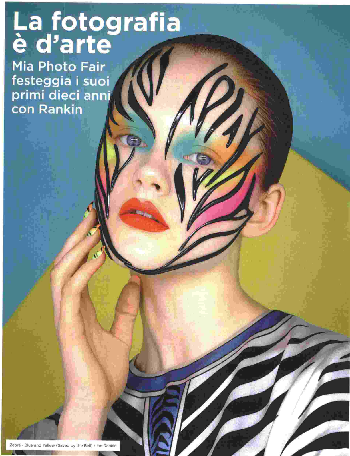
Zebra - Blue and Yellow (Saved by the Bell) - Ian Rankin

Mia Photo Fair festeggia i suoi primi dieci anni con Rankin