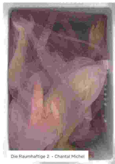
Die Raumhaftige 2 - Chantal Michel