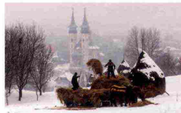
PhotoArt Vision 2018, Menzione d'Onore, Virgilio Bardossi, Hay

Info: photoart.salon@gmail.com http://vision.photoart.cz/