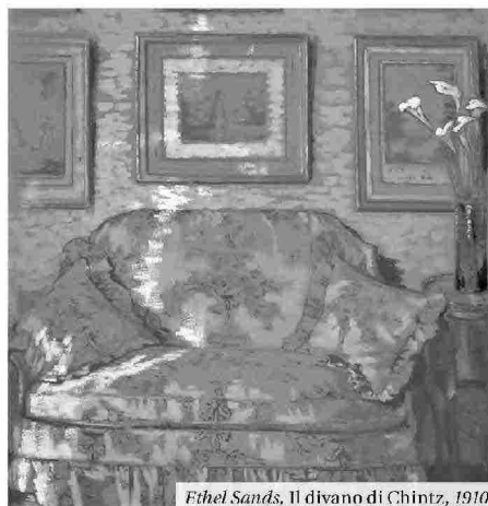
Ethel Sands, Il divano di Chintz, 1910

Tate St Ives Porthmeor Beach, St Ives (Cornovaglia, UK) 10 febbraio-29 aprile 2018