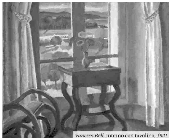
Vanessa Bell, Interno con tavolino, 1921