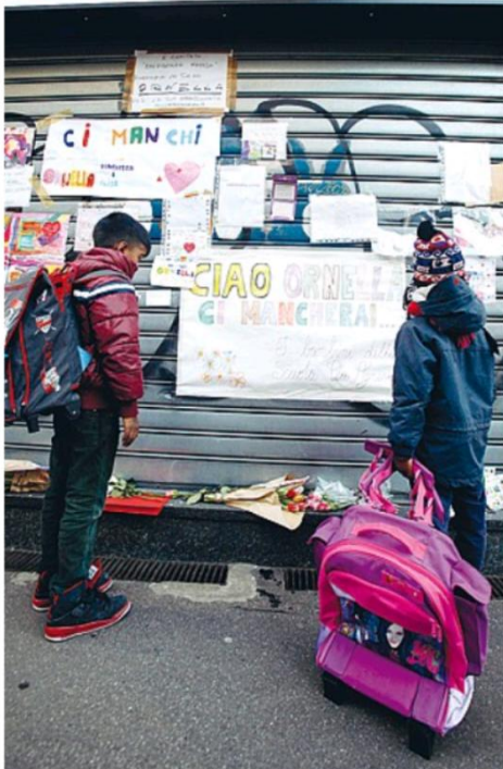
La serranda I messaggi di affetto lasciati dai bambini alla cartolaia di corso di Porta Vittoriana

Muore la cartolaia Gli alunni tappezzano di messaggi la saracinesca