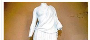
I danni La statua vandalizzata alla Guastalla

Guastalla, vandali scatenati La ninfa resta senza braccia