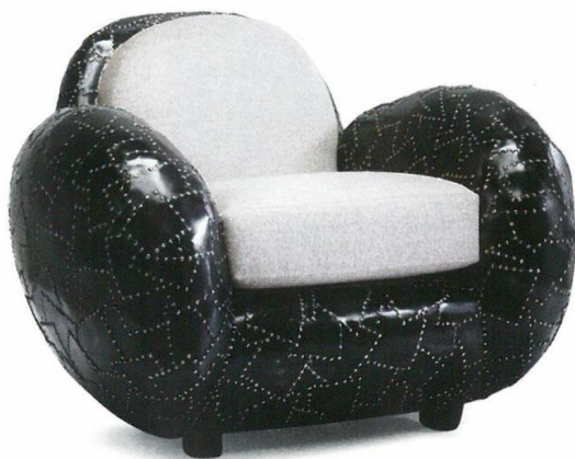
SOTTO LA CORAZZA New York