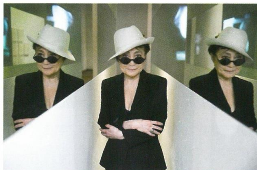
SEMPRE ALL'AVANGUARDIA Lione

Rivestita da un patchwork di tessere d'acciaio con impunture che disegnano motivi geometrici, la Carapace Armchair (sopra) è una seduta dai volumi avvolgenti. Questa poltrona e altri arredi in edizione limitata creati dal designer olandese Maarten Baas, tra cui mobili contenitori e sideboard, fanno parte della nuova collezione Carapace , esposta alla Carpenters Workshop Gallery.