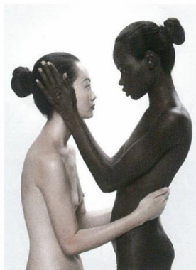
SCATTI D'AUTORE Milano