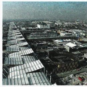
L'area Continua lo smantellamento nel sito Expo a Rho