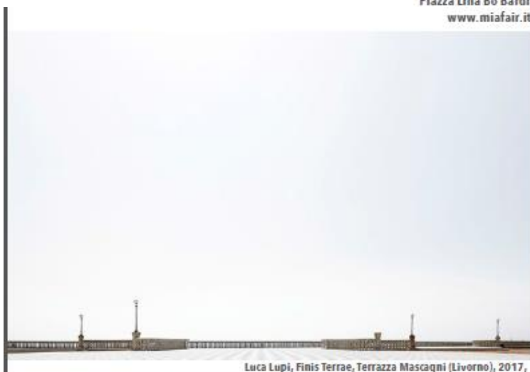
Luca Lupi, Finis Terrae, Terrazza Mascagni (Livorno), 2017,