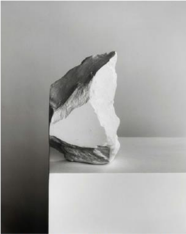
Darren Harvey-Regan, The Erratics (#wrest 10) , 2015, fiber based handprint, 60x48 cm, Ed. 1/6