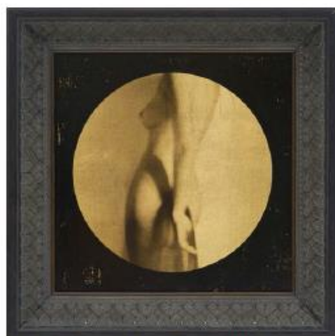
Corinne Héraud, Series Corpus, "Corpus # 2", 2017,