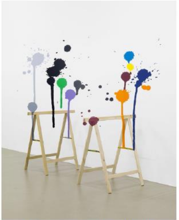
Igor Eskinja, ProcessionDecor , 2009, Lambda Print, 150x120 cm, Edition of 3 + 2AP