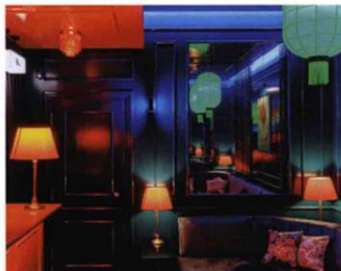
House of Ronin: cucina giapponese a Chinatown.

dell'artista americano, amato da star del cinema e musicisti (via Tortona 56, fino all'11/9, mudec.it). La sera dell'8 al Teatro Lirico Giorgio Gaber va in scena Amici Fragili , la storia curiosa del legame tra Gigi Riva e Fabrizio De André, raccontato con le parole dello storyteller Federico Buffa (via Larga 14, teatroliricogiorgiogaber.it). Il 9, Teatro alla Scala ospita il Galà Fracchi , un omaggio all' étoile milanese attraverso i balletti più significativi della sua carriera, da Giselle a La morte del cigno , interpretati, fra gli altri, da Alessandra Ferri e Roberto Bolle (teatroallascala.org).