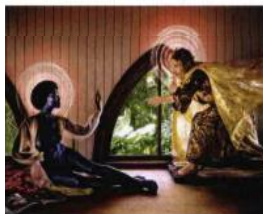
David La Chapelle, Annunciation , Hawaii, 2019. Al Mudec.

La Chapelle al Mudec. Le grandi gallerie a Fiera Milano City e la fotografia d'autore al Superstudio Maxi. Serate in compagnia: il Giappone a Chinatown, il ritorno dell'assenzio