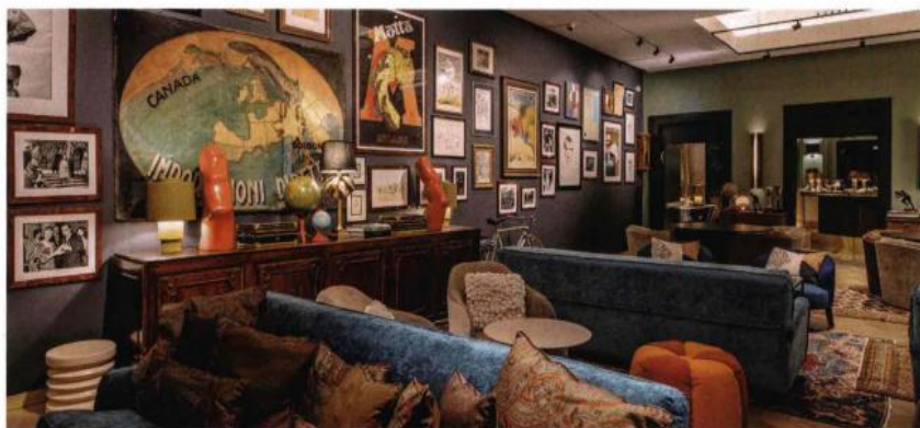
Atmosfera vintage per Veloce, cocktail bar nell'ex sede del Touring Club in corso Italia.