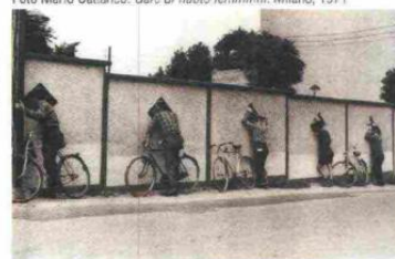
Gare di nuoto femminili, Milano, 1971

Nel 2020 il Circolo Fotografico Milanese ha raggiunto i novant'anni di attività. Per festeggiare un anniversario così importante il circolo ha deciso di presentare al pubblico la mostra L'occhio del Milanese - I 90 anni del Circolo Fotografico Milanese che raccoglie gli scatti dei suoi soci in un'esposizione che ne racconta le attività e la forte passione. La mostra, visitabile dal 19 ottobre al 10 dicembre, ha sede presso la Galleria Credito Valtellinese in Corso Magenta, 59 a Milano. Orari: martedì, 10-12; mercoledì, giovedì e venerdì, 14-19. Ingresso gratuito. circolofotograficomilanese.it