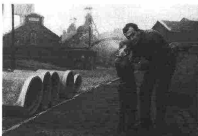
Belgio, Marcinelle, su Oggi del 5 marzo 1964

Tra gli eventi da non perdere, segnaliamo la mostra Il lungo addio. Storie dei nostri emigranti dell'Italia del boom , realizzata con fotografie d'epoca sull'emigrazione italiana nell'immediato dopoguerra.