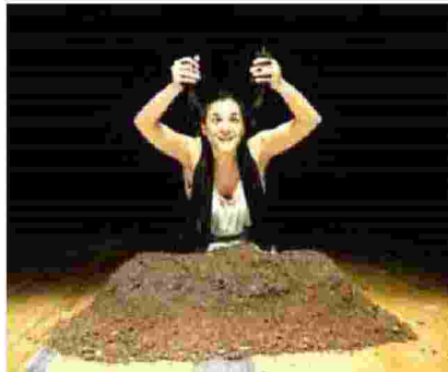
L'attrice Tiziana Vaccaro darà vita a «Terra di Rosa»