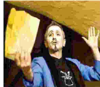
Il «Magic Family Show» della Compagnia Teatro dei Mille Colori