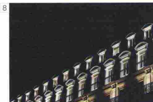
8 | Nicola Cicognani Paris, Rue du Pont Neuf , 2014.

La rappresentazione coordinata della IX edizione è stata realizzata dall'artista norvegese Rune Guneriussen, le cui immagini sono state esposte in numerose fiere, mostre personali e collettive in tutto il mondo. Nei suoi progetti l'artista inserisce oggetti costruiti dalla mano dell'uomo per realizzare installazioni temporanee nell'ambiente naturale,