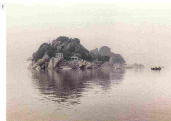
9 | Giulio di Sturco Ganges, India, 2014

inserendole al centro delle sue immagini fotografiche. Il lavoro di Guneriussen pone l'attenzione su uno dei problemi principali della società contemporanea, ovvero l'importanza di mantenere stabile il delicato equilibrio tra uomo e natura. L'autore sarà presente durante i giorni della fiera dove terrà un incontro su questo tema. ■