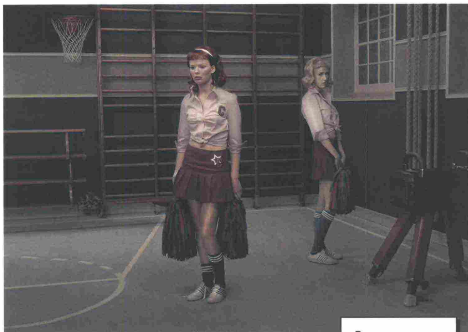
Foto esposta a Milano in occasione della IX edizione del MIA PHOTO FAIR dello scorso marzo.

ERWIN OLAF, "RAIN, The Gym", 2004, c-print, 22 x 31 cm, edizione 14/15.