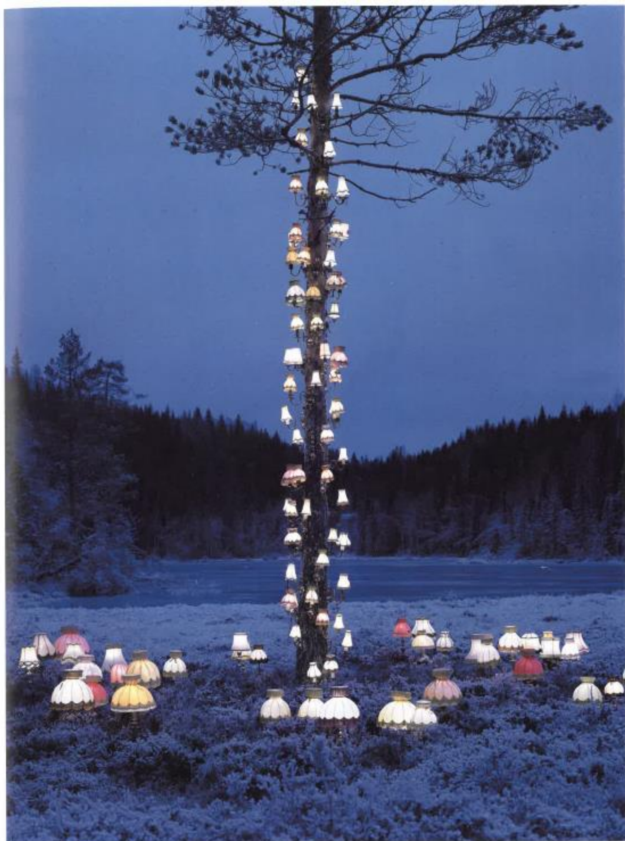
THE FASHIONABLE LAMPOON feat. MIA PHOTO FAIR