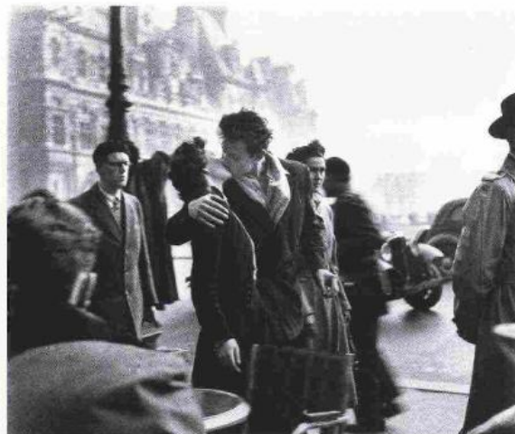
sopra | © Atelier Robert Doisneau, Le Baiser de l'hôtel de ville , Paris 1950