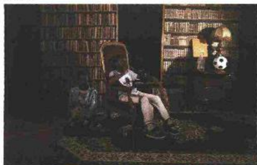
HALIDA BOUSHRIET, PANDORE, 2014, C-PRINT 6 HALIDA BOUSHRIET