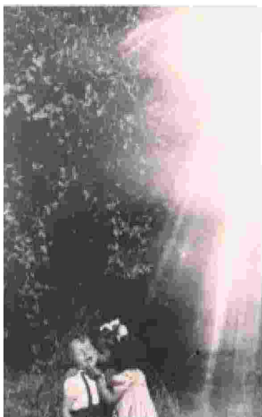
Photo trouvée è un'arte anonima che si nasconde fra altre fotografie sparse, finché qualcuno non la riconosce e le restituisce il suo valore autentico

Ritaglio stampa ad uso esclusivo del destinatario, non riproducibile.