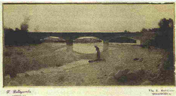
Sopra e a destra, due fotografie di Pellizza da Volpedo; in alto, un ritratto dell'autore

"Il Quarto Stato e il territorio di Volpedo nelle fotografie del fondo Giuseppe Pellizza, con un omaggio a Paolo Monti" è come un viaggio da percorrere all'interno di un archivio facendosi suggestionare da un paesaggio collinare innevato dei suoi luoghi nativi nel Tortonese, da un ritratto dell'autore nel formato carte de visite (le fotografie tascabili usate come biglietti da visita) da uno scorcio del paese con le strade in acciottolato o da una sua piazza nel giorno del mercato boario, ripresa dall'alto in una visione d'assieme. Osservando con attenzione questo materiale che ha anche un valore storico, si possono comprendere le analogie fra l'estetica del capolavoro del pittore concluso nel 1901 e il gusto compositivo che si ritrova nelle fotografie scattate da lui stesso o dagli autori, come Cicala e Bellaganba, con cui dialogava. La mostra è completata da alcune opere realizzate nel 1980 da Paolo Monti nell'ambito di una campagna dedicata all'opera di Pellizza.